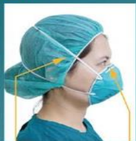
上下綁帶撐開 綁帶綁緊(可打結) 口罩應戴至鼻樑上端