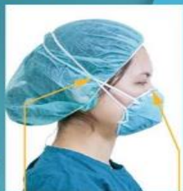
上下綁帶未撐開 綁帶未綁緊 口罩未戴至鼻樑上端