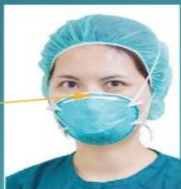
鼻翼處未捏緊壓條